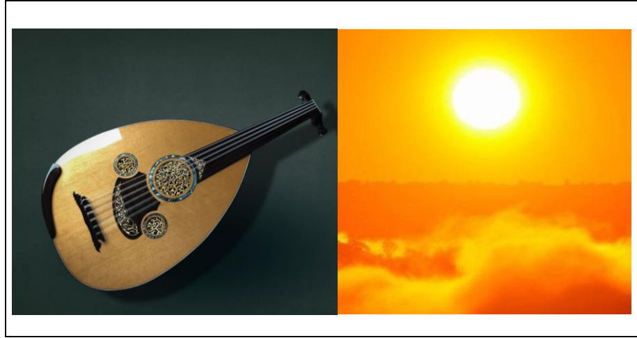
Resim 2. Ud-Emir Değirmenli 2020 yılı yapımı ud. Güneş resmi (Sözcü Astroloji).

Sûzidîl, gönül ateşi, yürek yanığı anlamında bir kelimedir. Güneş gibi yakıcı etkisi olan bir makamdır. Gönü yakan etkisi sebebiyle bu makamla başlamayı tercih etmiştir. Güneşin yakıcılığı ile Sûzidîl makâmının yakıcılığı arasında bağlantı kurmuştur. Tanrıkörur, eserde Nişâbürek, Bûselik, Hicaz geçkileri de kullanmıştır. Hem teknik açıdan hem de ifâde açısından zorlayıcı bir eserdir. Eserde kullanılan atlamalı aralıklar, ses alanları, perdeler, pozisyonlar eserin icrâsını teknik açıdan zorlaştıran yönlerdir. Eserde öne çıkan ud ve güneş temalarına âit görseller aşağıdadır (Resim 2).