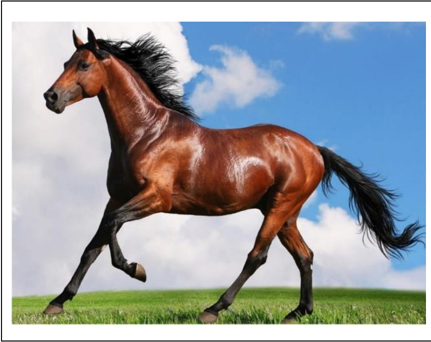
Resim 4. Yağız Küheylan, Z Dergisi 2018, Erişim târihi: 13.02.2021, Erişim adresi: https://www.zdergisi.istanbul/makale/arap-saf-kan-ati-276