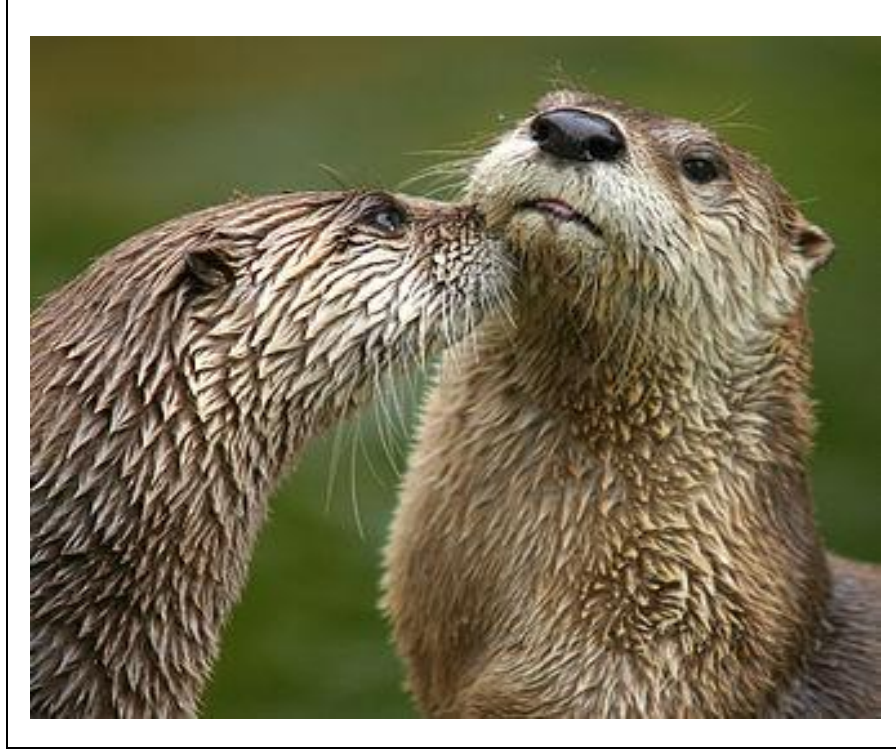
Resim 3. Kuzey Amerika Susamuru, Vikipedi, Erişim târihi:(13.02.2021). Erişim adresi: https://tr.wikipedia.org/wiki/Kuzey_Amerika_susamuru

hırınlıkları seyredince sanki iki âşık insanın birbirleriyle olan ilişkileri gözünde canlanır. Bunun üzerine “Susamurunun Aşkı” adında, Bûselik makâmında bir saz eseri bestelemeye karar verir. Susamurlarının bu hareketlerini ezgilerle özgün bir esere dönüştürür”. Susamurlarının bu hallerini temsil eden görsel aşağıdadır (Resim 3).