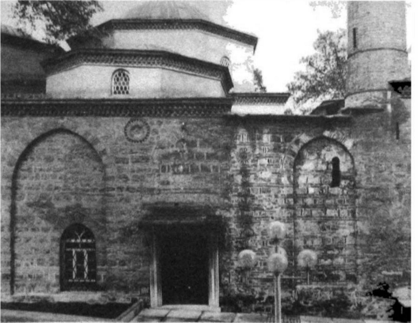
Bursa Orhan Bey İmâreti, doğu cephesi.

lı siyasî macerasını barış (ya da akomodasyon) taraftarlarıyla savaş (ya da sürekli genişleme) taraftarları arasındaki çatışmaya götürmesine gelmeliyiz. Halil Bey, orada Osmanlı-Türk siyaset tarihçilerine ufuk açan çok önemli bir şey kattı bence. O da, Osmanlı siyaset tarihini solidarist bir şekilde, iç çelişkileri önemsemeyen bir anlatı olmaktan çıkarması. Bir çekirdekten çıkarak pek de problematize edilmeyen bir dayanışma halinde sürekli genişleyen bir siyasanın hikâyesi olarak anlatmaktansa, gelişmekten farklı şeyler algılayan, gelişmeyi değişik stratejilere bağlayan ve birbirleriyle zaman zaman çelişen kişi ve zümrelerin biçimlendirdiği karmaşık bir tabloya oturtmasıdır. Özellikle II. Murad devrinde Halil İnalcık'ın sunduğu tablo şu: Bir yanda "şahinler", bir yanda "güvercinler". Şahinleri gaziler temsil ediyor, uç işletmek isteyenler. Güvercinleri de daha çok Çandarlı'nın başı çektiği bürokrat bir kesim temsil ediyor. Sonunda bu iki kesim de kazanamıyor aslında. İlginç olan, Fatih'in bu çelişkiyi fark edip yönlendirerek kullanmasıdır. İstanbul'u fethettikten sonra her iki fraksiyonu da bertaraf ederek, siyasî nü-